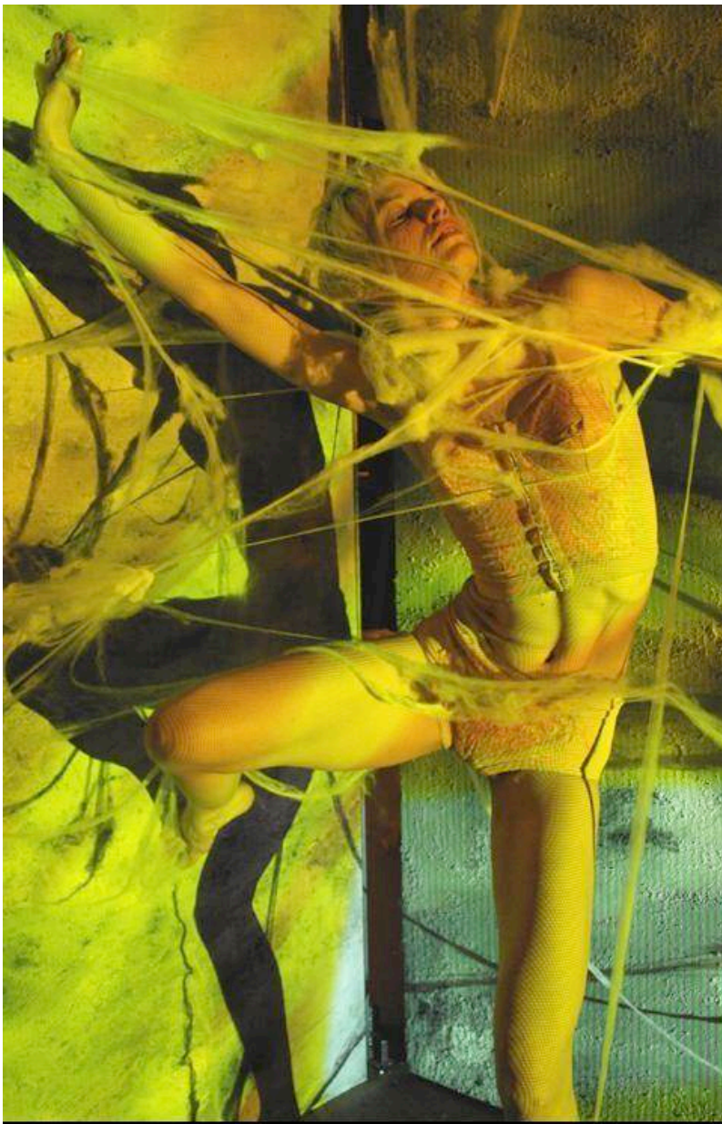
Las representaciones de este ciclo alcanzan gran espectacularidad